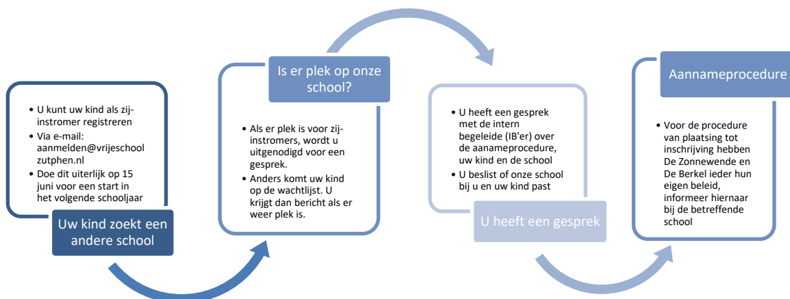
Afbeelding 2. Schema registratie- en plaatsingsprocedure zij-instromers

In mei wordt jaarlijks de wachtlijst opgeschoond. Ouders die hun kind op de wachtlijst hebben laten zetten, worden benaderd met de vraag of dit nog steeds gewenst is. Bij geen reactie binnen twee weken wordt het kind van de wachtlijst verwijderd.